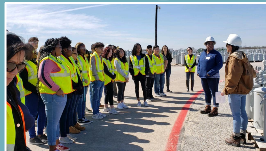
Oncor Electric | Oncor eléctrico